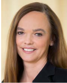
Dr. in Sonja Hammerschmid

Die Weiterentwicklung der Grundschule ist das pädagogische Herzstück der Bildungsreform. Die einzelnen Maßnahmen müssen zusammen mit den Neuerungen im elementarpädagogischen Bereich gesehen werden und haben das Ziel, die Kinder mit ihren verschiedenen Interessen und Potentialen zum Ausgangspunkt für die Planung und Gestaltung von Bildungsprozessen zu machen.