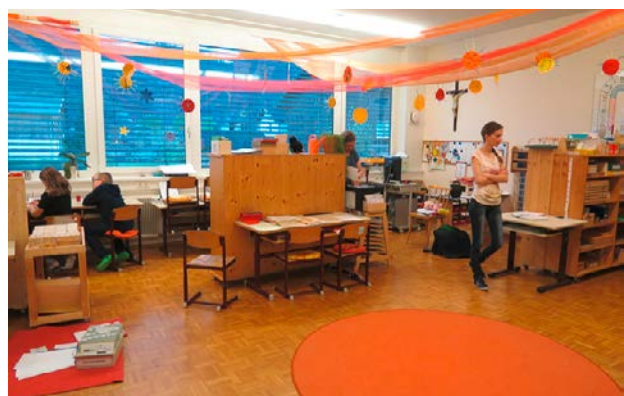
Abbildung 4: Klassenzimmer mit großem, runden Teppich VS Ludesch