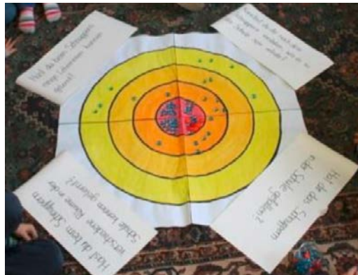
Abbildung 8: Evaluations-Zielscheibe VS Goritschach (Schönherr, 2015)

In Goritschach 26 ist die Volksschule durch einen angebauten Turnsaal direkt mit einem der Kindergärten verbunden, eine Zusammenarbeit der beiden Institutionen gab es bis vor wenigen Jahren jedoch nicht. Informationen über Stärken und Schwächen der Kinder im letzten Kindergartenjahr durften nicht an das Lehrpersonal der Schule weitergegeben werden, wodurch wertvolle Zeit in der Schuleingangsphase verloren ging. Diesem Umstand wollte der Volksschuldirektor entgegenwirken und entwickelte die Idee, die Gruppe der zukünftigen Schulkinder bereits in das Schulgebäude einzugliedern. Nach umfangreichen Umbauarbeiten und großer Zustimmung seitens der Eltern ließen sich im neuen Kindergarten in der Volksschule sogar drei Gruppen bilden. Zwei weitere Kindergärten der Gemeinde bekundeten ebenfalls ihr Interesse an dem Projekt, sodass sich schlussendlich insgesamt fünf Kindergartengruppen wöchentlich abwechselten und an jedem Dienstag in Kleingruppen von maximal zehn Kindern für eine Stunde am Klassenunterricht teilnahmen. Eine mögliche Angst vor der Schule sollte minimiert werden, indem die Kinder sich mit der Infrastruktur, dem Schulgebäude und den Lehrkräften bereits vor Schulbeginn vertraut machen konnten.