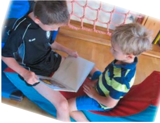
Abbildung 7: Partnerkind mit »Schützling« VS St. Oswald

Zusammenfassung der Vorschulklasse bis zur 2. Schulstufe zu Familienklassen (Mehrstuftklassen) gefördert. Zur Erhaltung und Verbesserung der Schul- und Unterrichtsqualität dienen jährliche Evaluierungen mittels Fragebögen als Grundlage zur Reflexion und Schulentwicklung.