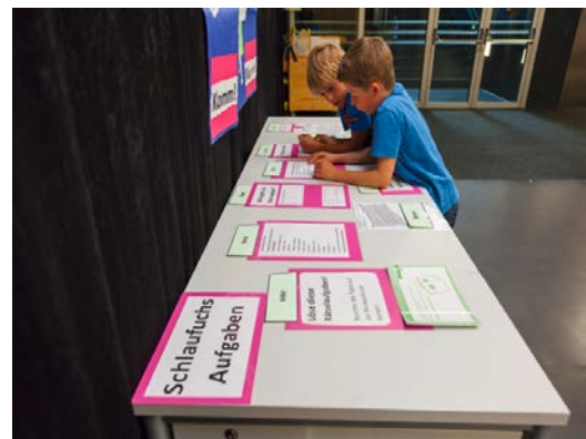
Abbildungen 1 und 2: Schlaufuchstisch der VS Weyer