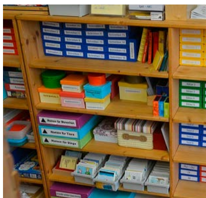
Abbildung 3: Differenzierte Materialien VS Ludesch

Die Unterrichtsmaterialien sind nach Fächern und Schwierigkeitsgraden in verschiedenen Regalen geordnet und jederzeit für die Schülerinnen und Schüler zur selbstständigen Nutzung zugänglich. Zudem befindet sich ein großer runder Teppich im Raum, der zum gemeinsamen Arbeiten und Verweilen einlädt